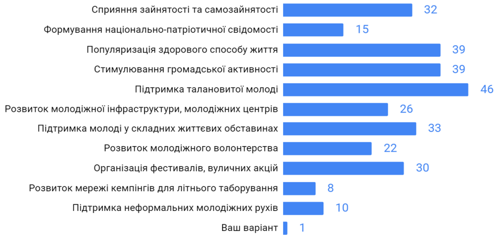
Табл 2.3. Найбільш важливі напрямки роботи з молоддю в громаді на думку жінок